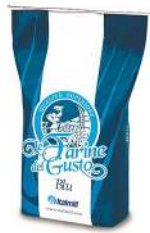
Miscela Del Gusto Blu Rpc 00 Flour 10kg 意塔米尔经典披萨预拌粉10公斤