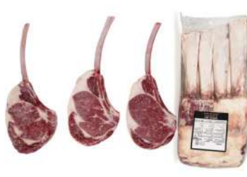
RU 32# Miratorg Beef Tomahawk Choice 俄罗斯32#战斧牛排特选级