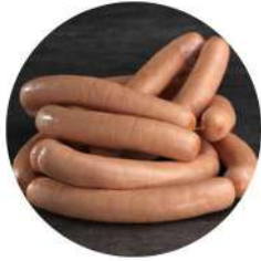
Confee Strasbourg Sausage 250g Confee 斯特拉斯堡香肠250克