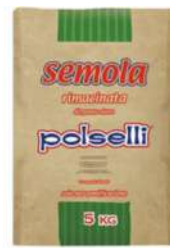
Polselli Semola 5kg 波塞利意面预拌粉5公斤