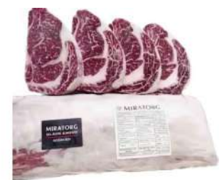
RU 32# Miratorg Beef Cube Roll Ribeye Prime 6kg/pc 俄罗斯广肉眼去油边极佳级条