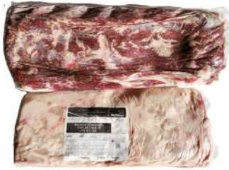
AR 1920# Rioplatense Beef Striploin Grain Fed 3-4kg 阿根廷1920#谷饲西冷3-4公斤