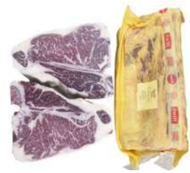
US 969# Swift Beef Shortloin USDA Prime (T-bone) 美国969#带骨牛腰脊肉佳级