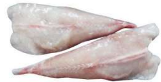
Frozen Monkfish Fillet 2kg 冰冻安康鱼柳2公斤