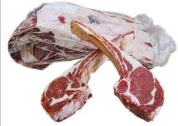
AU 218#262# Beef Tomahawk Grain Fed 澳洲218#262# 牛战斧带骨脊排谷饲218#262#