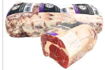
AU 154# Augus Reserve Beef CubeRoll Ribeye M3+ 澳洲154#亚安格斯眼肉M3+