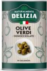
Delizia Pitted Green Olives 4.25kg 得里刺亚牌去核绿橄榄罐头4.25公斤