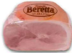
Beretta Antico Sapore Cooked Ham 4-5kg 柏瑞塔意式传统熟火腿4-5公斤