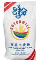
Hight Gluten Wheat Flour 25kg 金磨粉高筋小麦粉25公斤