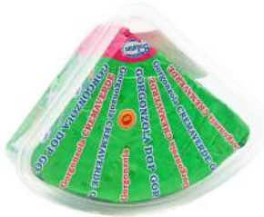
Ballarini Gorgonzola 1.5kg 波洛尼牌哥根苏拿干酪1.5公斤