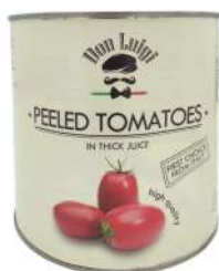
Don Luigi Peeled Tomatoes 2.55kg 丹卢意吉牌浓汁去皮番茄2.55公斤