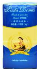
Local Semola 1kg 三文尼娜粉1公斤