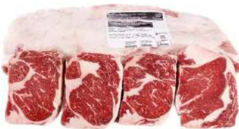
AR 1920# Rioplatense Beef Cube Roll Ribeye Grain Fed 3-4kg 阿根廷1920#谷饲眼肉整条3-4公斤