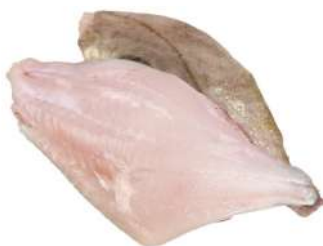
Frozen John Dory Fillet 2kg 冰冻鳎鱼柳2公斤