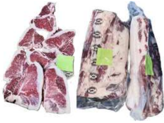
AU 648# Harvey Beef Shortloin T-Bones Grain Fed 哈维牌澳洲谷饲天厂腰脊肉骨