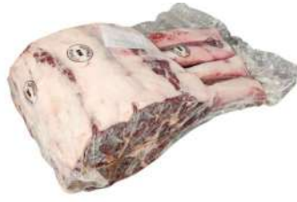
AU 154# Angus Reserve Beef Tomahawk M5+ 澳洲154#战斧带骨牛肉脊排M5+