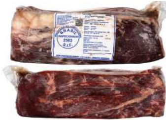
BR 4507#385#2583#42# Beef Ribeye 巴西4507#385#2583#42#牛眼肉