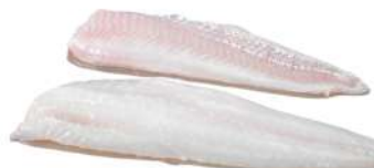
Sea Bass Fillet Skin Off 350g 海鲈鱼柳片350克