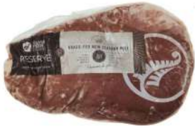
NZ Reserve Flank Steak 新西兰银爵珍藏级草饲牛腩排