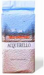
Acquerello Rice 2.5Kg Bag 意大利顶级陈年米-1年 2.5公斤