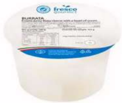
Fresco Gourmet Burrata 125g 鲜口福牌布拉达奶干酪东泽莱塔牌布拉达奶干酪125克