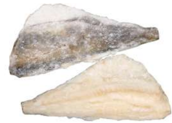
Frozen Sea Bass Skin On 500-600g 清洁海鲈鱼带皮条500-600克