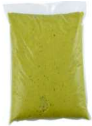
Solpuro Frozen Avocado Puree 500g 愨思冷冻牛油果果浆袋箱500克