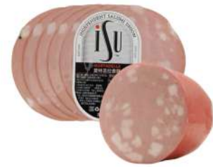
Iso Mortadella With Pistachios 2.5kg 莫特塔拉式香肠开心果2.5公斤