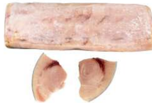
Frozen Swordfish 5kg 冰冻剑鱼柳5公斤