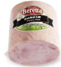
Beretta French Cooked Ham 3kg 柏瑞塔法式火腿3公斤