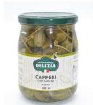
Delizia Capers Stem Con Gambo 580ml 得里刺亚牌带柄刺山柑罐头580毫升