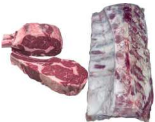
AU 154# Angus Recerve Beef Ribeye Bone In (Op Ribs) M3+ 澳洲154#安格斯谷饲带骨脊排带骨眼肉M3+