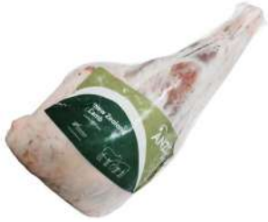
NZ Lamb Leg With Bone 2kg 新西兰带骨羊腿2kg