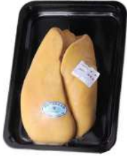
Falan High-End Goose Foie Gras 800g 法兰优选肥肝800克