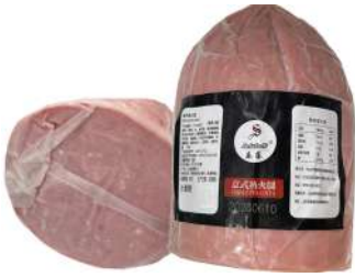
Salutelli Prosciutto Cotto Cooked Ham 2.5kg 乐藤牌意式熟火腿2.5公斤