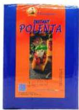
Pasta Roma Polenta 750g 意大利快速玉米粉750克