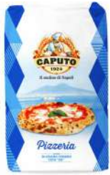
Caputo Pizza Flour 25kg 卡普托披萨专用预拌粉(蓝) 25公斤