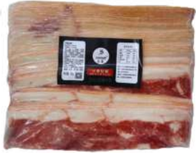
Salutelli Breakfast Bacon 1kg 乐腾牌早餐培根1公斤