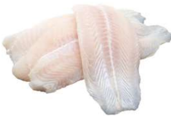
Basa Fish Fillet 2kg 巴沙鱼柳片2公斤