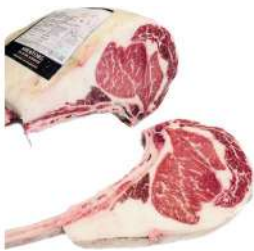
RU 36# Primebeef Beef Tomahawk Grain Fed Prime 俄罗斯36#冷冻极佳级战斧牛排