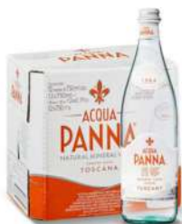
Acqua Panna Natural Water 750ml 普娜天然饮用水750毫升