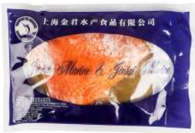
Frozen Cold Smoked Salmon Fillet Sliced 200g 冷冻烟熏三文鱼切片200克