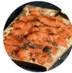
Confee Sliced Salmon Gravlax 150g Confee 切片腌制三文鱼150克