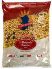
Sarda Fregola Sarda 500g 拉卡萨牌弗雷戈意大利面500克