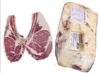
RU 32# Miratorg Beef Ribeye Bone In (Op Ribs) Choice 俄罗斯32#特选带骨眼肉