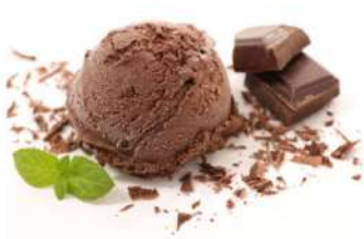
La Perla Chocolate Ice Cream 2kg 巧克力冰淇淋2公斤