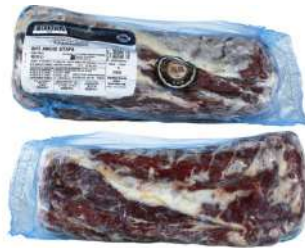
AR 3270# Beef Ribeye Grain Fed Angus Certified 阿根廷3270#牛眼肉安格斯天谷饲