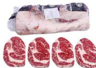
AU 154# Augus Reserve Beef CubeRoll Ribeye M5+ 澳洲154#安格斯眼肉M5+