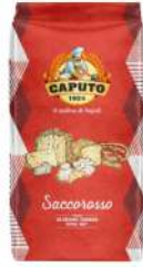
Caputo 00 Saccorosso Premixed Flour 25kg 烘焙预拌粉 (Red红包)