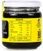
Autic Cuttlefish Ink 180g 奥帝牌墨鱼汁180克