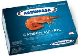
AR Arbumasa Prawns (L1) 2kg 阿根廷红虾大蓝盒(L1) 2公斤