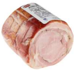
Beretta Porchetta Rolled-Up Roasted Pork 2-2.5kg 柏瑞塔意式猪肉卷2-2.5公斤