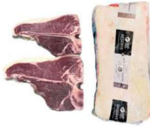
NZ Reserve Shortloin T-Bone 新西兰银爵珍藏级草T饲骨