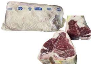
US 969# Swift Beef Shortloin USDA Choice (T-bone) 美国969#冷冻带骨牛前腰脊肉特选级