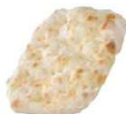
Scrocchiarella Frozen Pizza Base (Medium) 38cm x 18cm 270g*20 pcs/Box 罗马冷冻饼底中号