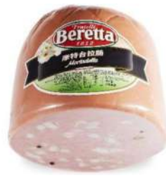
Beretta Mortadella Italiana 2.5kg 柏瑞塔莫特台拉肠2.5公斤