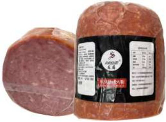
Salutelli Prosciutto Praga 2.5kg 乐藤牌布拉格火腿2.5公斤