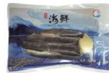
Smoked Herring 400g 烟熏鲱鱼柳400克