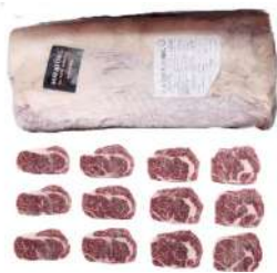
RU 32# Beef Cuberoll Ribeye Choice 俄罗斯32#份装牛眼肉特选级