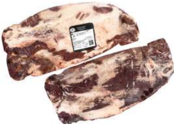
AR 2520# Beef Brisket 4kg 阿根廷2520#冷冻牛胸肉4公斤