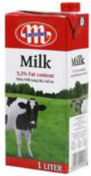
Mlekovita Whole Fat Milk 3.5% 1L 全脂纯牛奶3.5% 1升