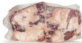
US 783# Beef Angus Ribs Bone In 3 bone Choice 美国783#带骨牛肋骨牛仔骨支骨