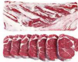
AR 1352#2035# ULSA Beef Ribeye Grain Fed 阿根廷1352#2035#牛眼肉谷饲