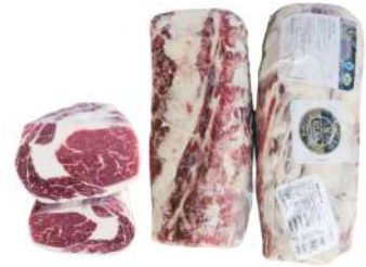
AR 1352# ULSA Beef Cuberoll Ribeye Grain Fed 2.5kg 阿根廷1352#牛眼肉谷饲2.5公斤