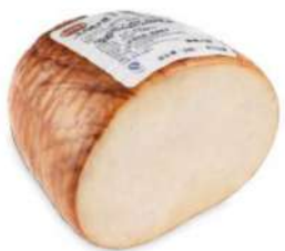
Beretta Turkey Cooked Ham ±2kg 美式火鸡胸火腿±2公斤