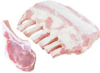
AU 194# Veal Whole Rack 2.5-4kg 澳洲194#冷冻小牛排 2.5-4公斤