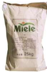
Miele Pizza Flour 25kg 蜜雷牌匹萨小麦粉