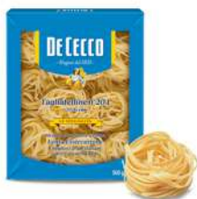
Dececco Tagliatelline #204 500g 得科牌号窄身形意大利窄身卷面204 500克