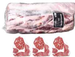
AU 1265# Phoenix Beef Angus CubeRoll Ribeye M3+ Portioned: 200g/pc 澳洲1265#黑凤凰去骨牛肉眼肉心份装份M3+